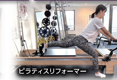
ピラティスリフォーマー